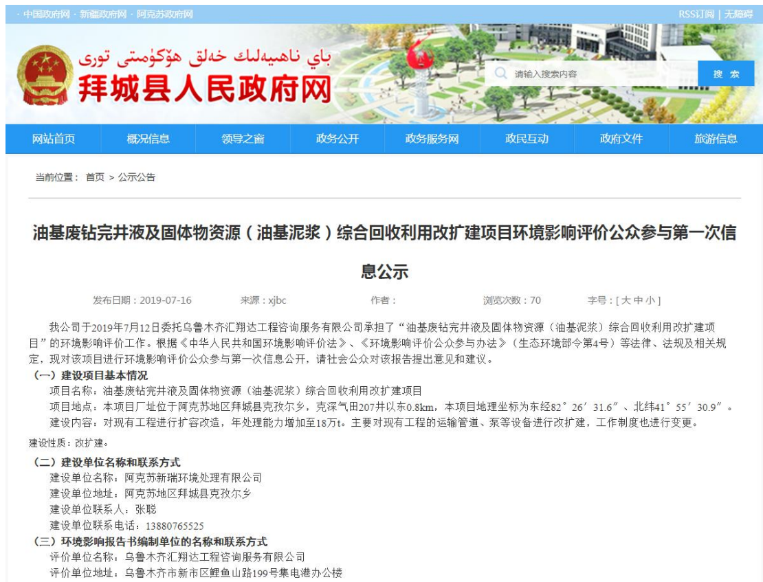
图 2-1 本项目第一次网络公示截图