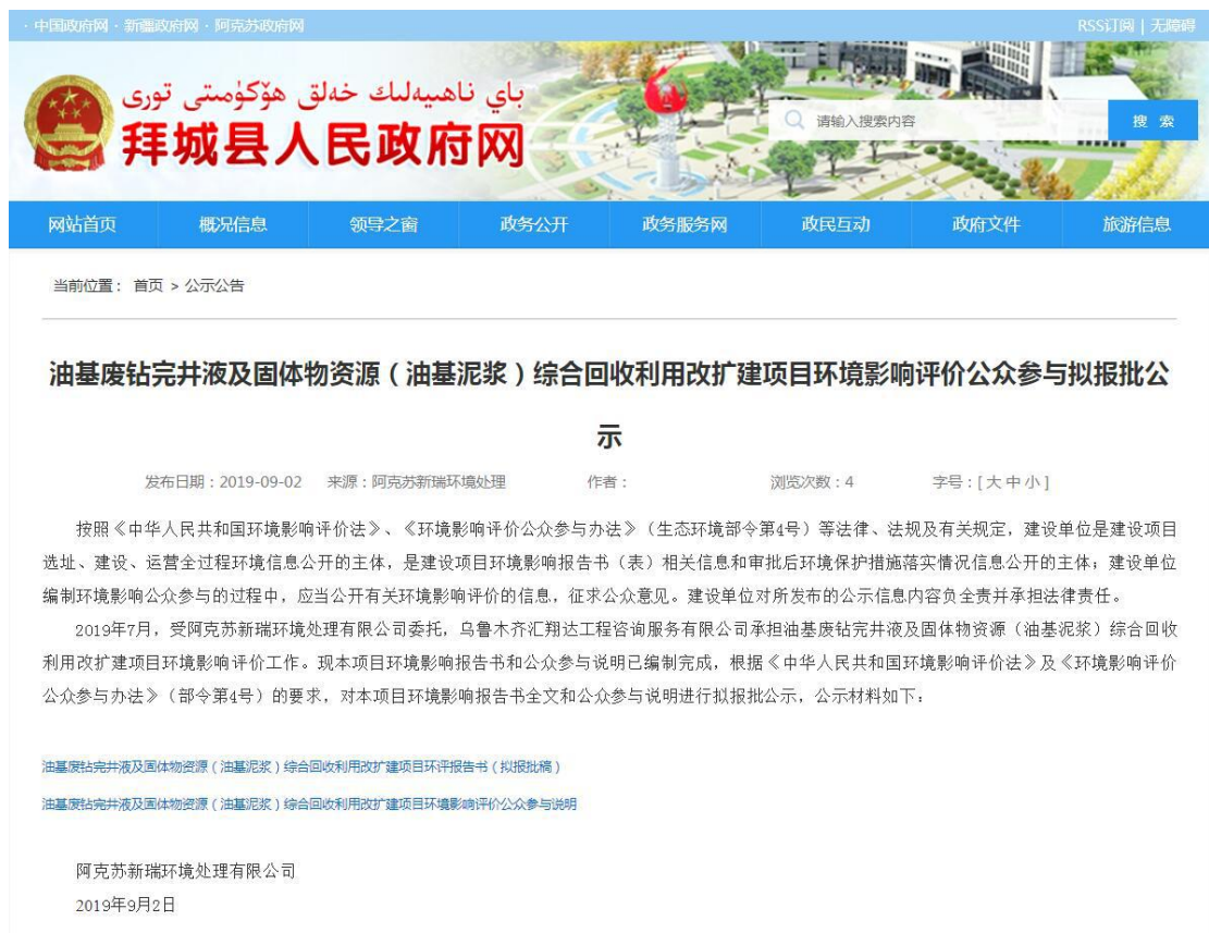
图 6-1 本项目拟报批网络公示截图