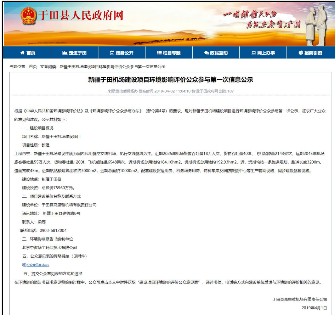
图 1 首次环境影响评价信息公开截屏