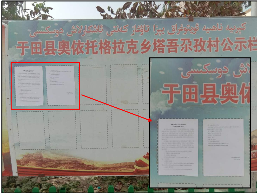
图 5 塔吾阿孜村村委公示张贴