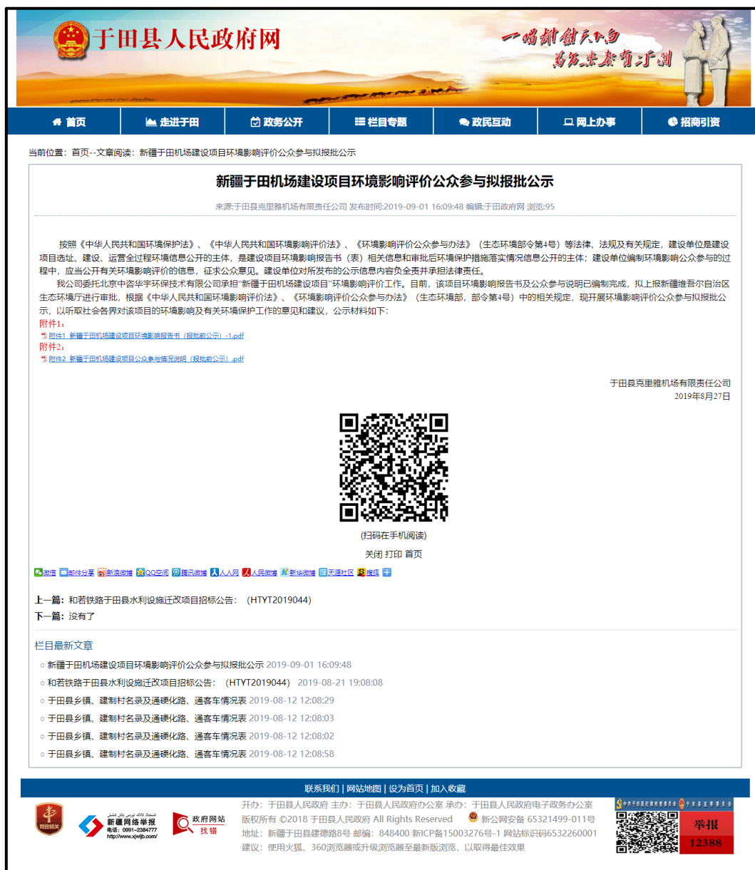
图 6 本项目拟报批网络公示截图

因为本项目未收到公众对环境影响方面提出的反馈意见，所以未开展公众座谈会、听证会、专家论证会等深度公众参与，符合《环境影响评价公众参与办法》要求。