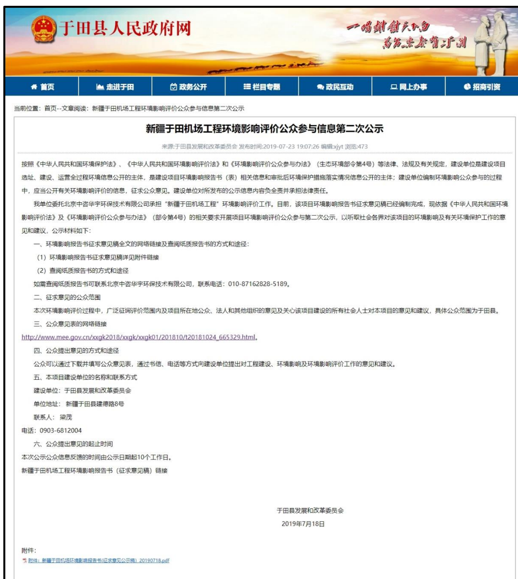
图2 环境影响报告书征求意见稿公开截屏