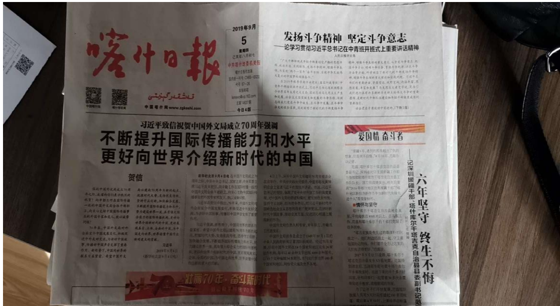
图 2.2.1-3 2019 年 9 月 5 日公示内容