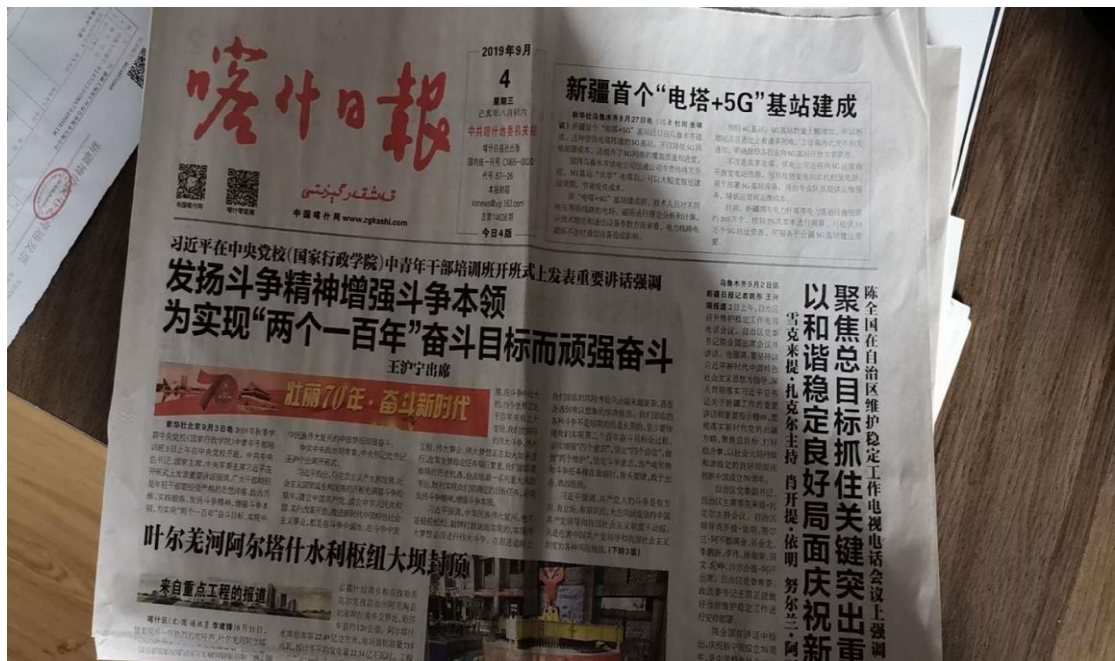
图 2.2.1-1 2019 年 9 月 4 日公示内容