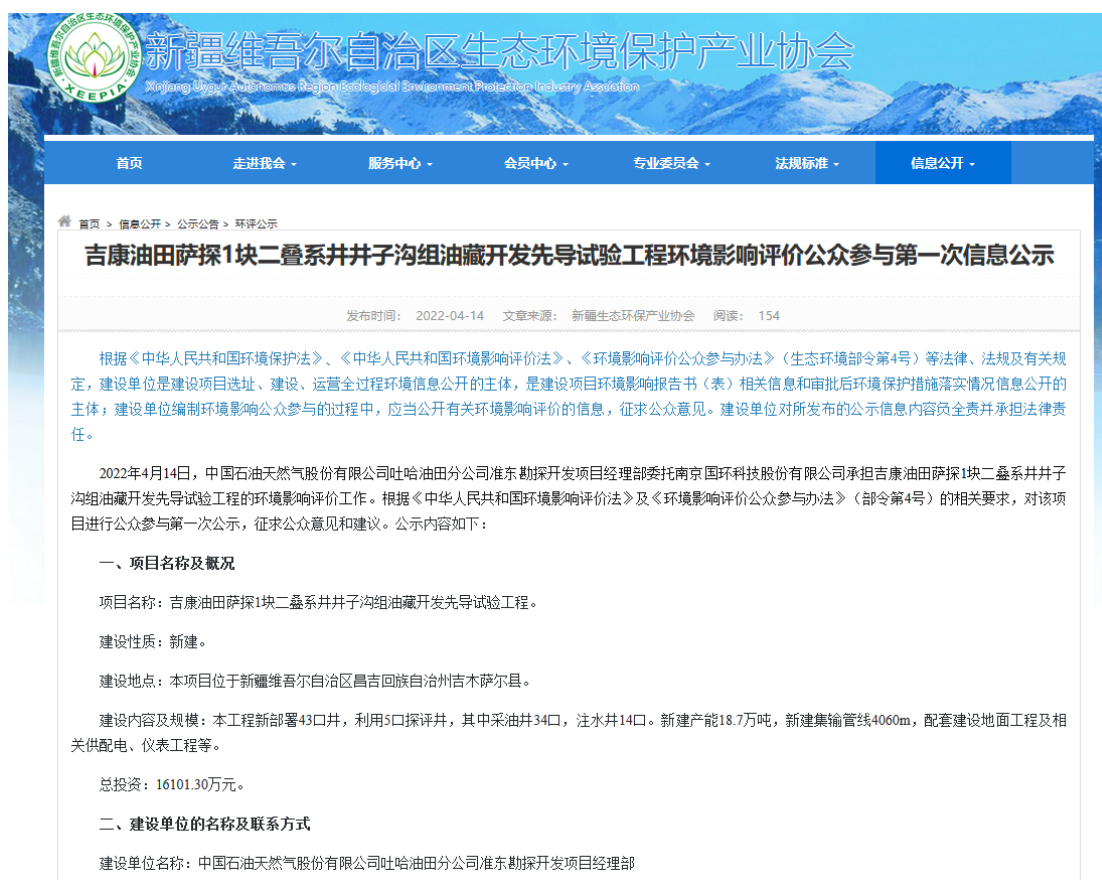
图1 本项目第一次网络公示截图

中国石油天然气股份有限公司吐哈油田分公司准东勘探开发项目经理部在新疆维吾尔自治区生态环境保护产业协会网站开展网络公示，载体选择符合《环境影响评价公众参与办法》要求。网络公示截图见图1。