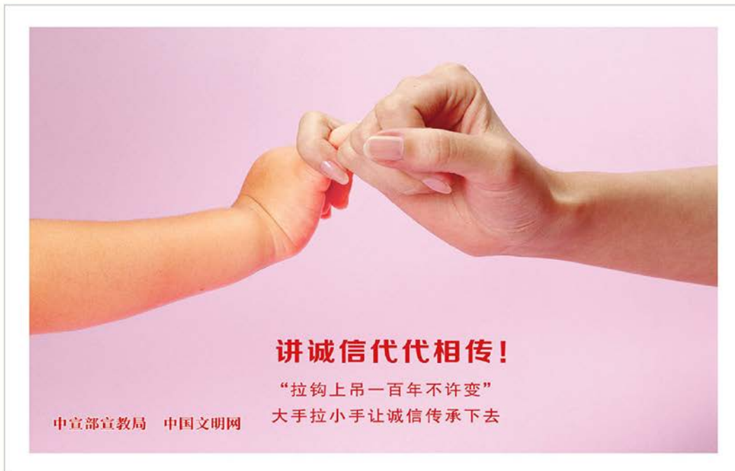
图3 本项目第一次报纸公示照片