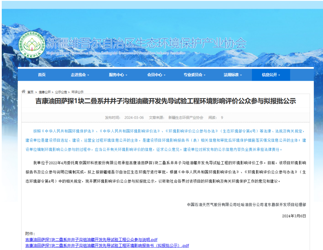
图 6 报批前网络公示截图