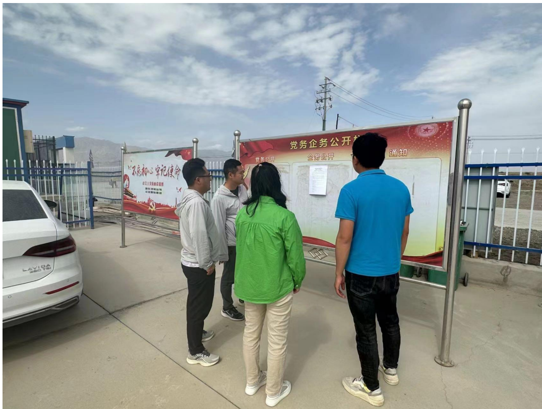
图 5 张贴照片