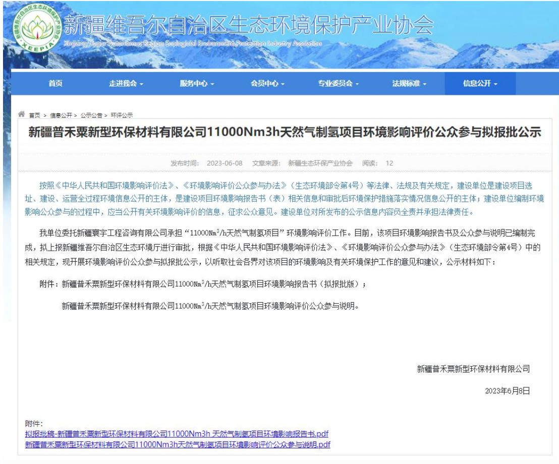
图 8 拟报批网络公示截图