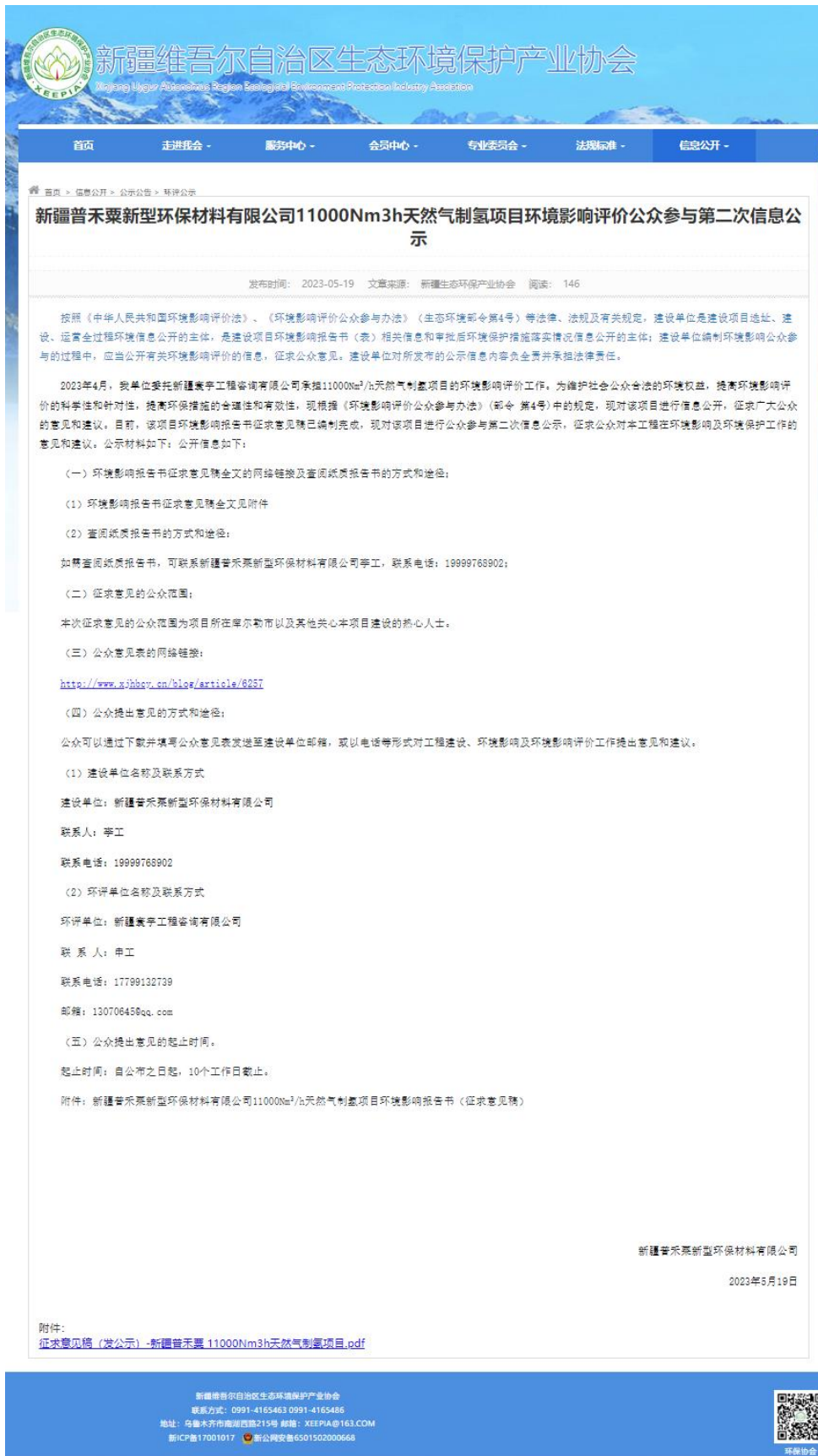
图 1 征求意见稿网络公示截图