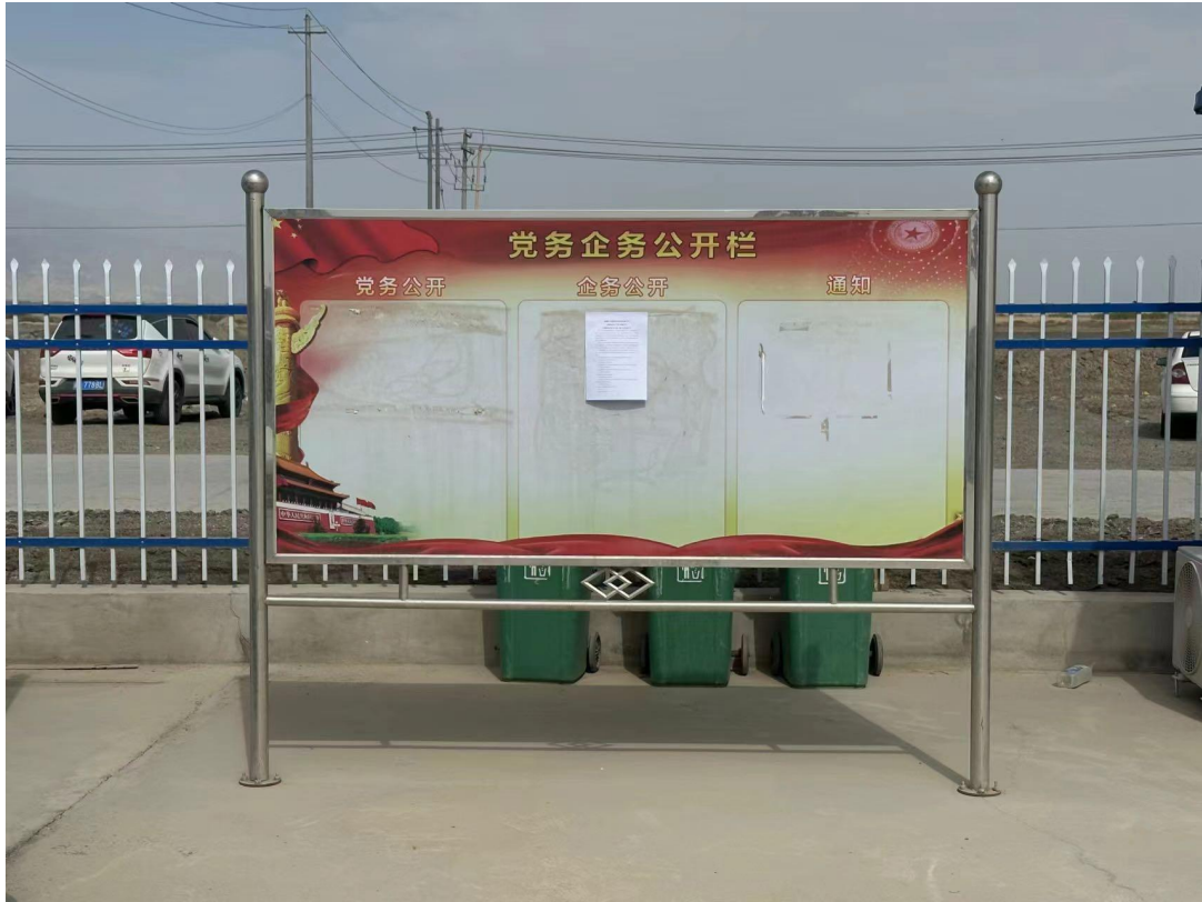
图 7 张贴照片