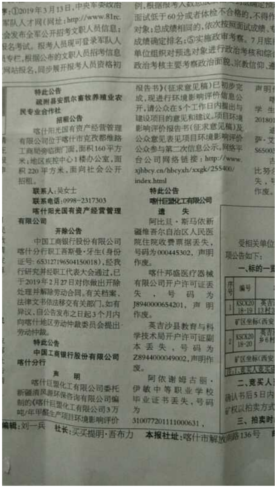
图3 本项目第二次报纸公示照片