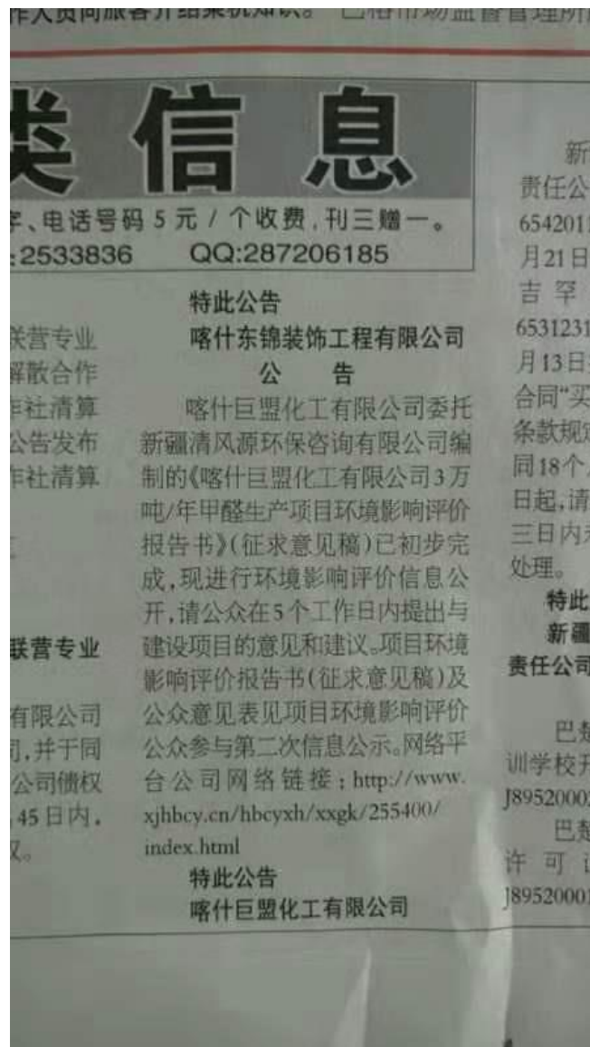
图 2 本项目第一次报纸公示照片