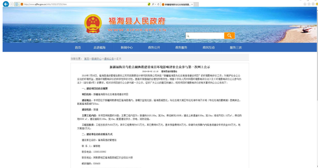
图 2-1-1 第一次网上公示截图