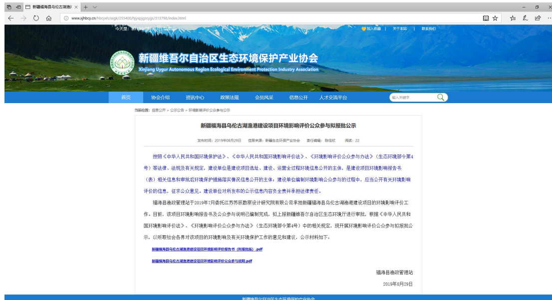
图 6-1 第三次公示截图