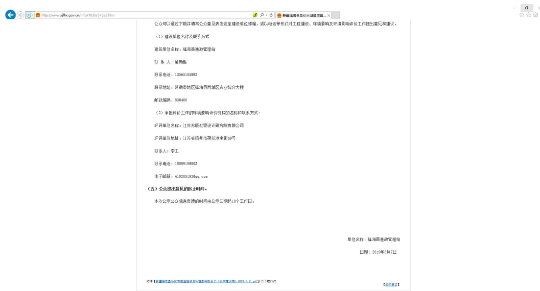
图 3-1-2 第二次网上公示截图