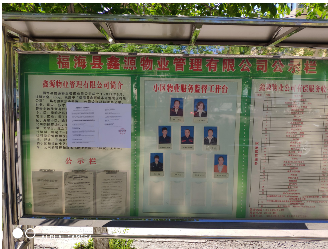
图 3-4-1 张贴公示