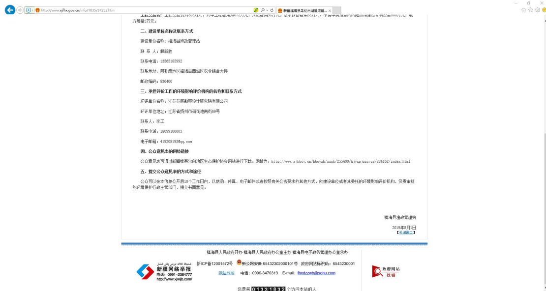
图 2-1-2 第一次网上公示截图