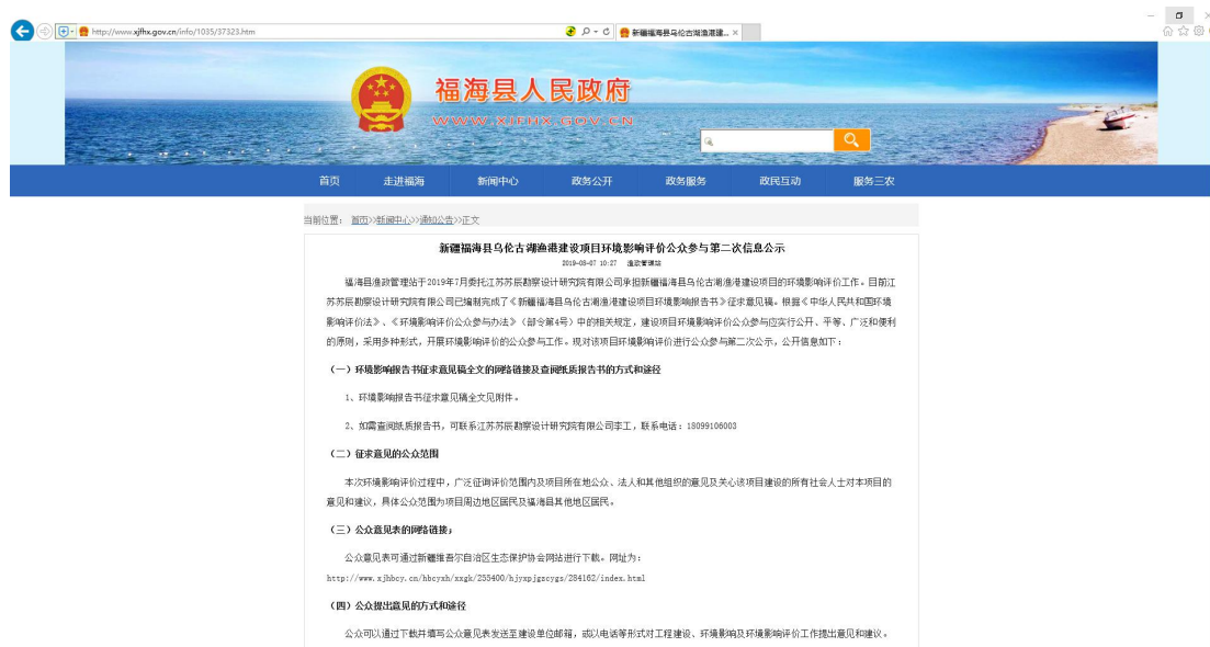
图 3-1-1 第二次网上公示截图