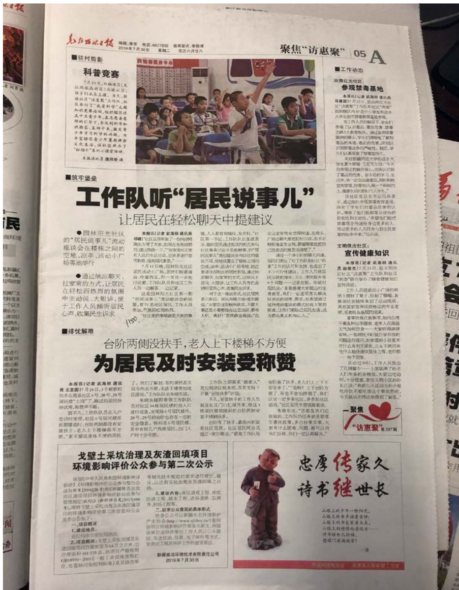
图 3-2-1 2019 年 7 月 30 日报纸公示