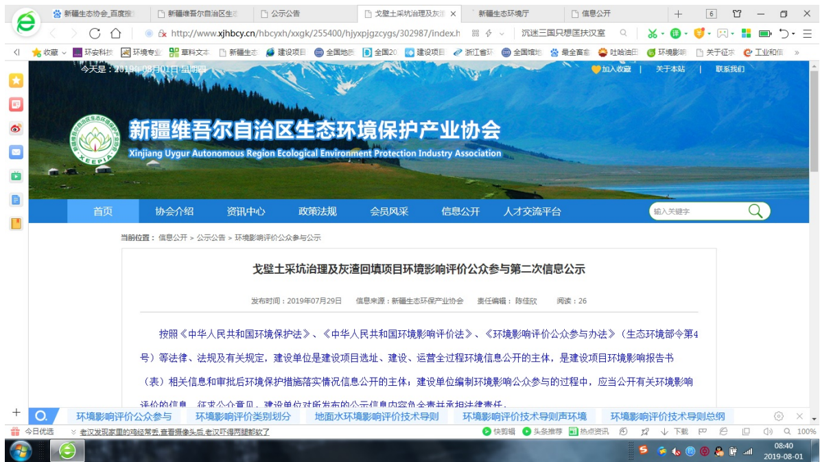
图 3-1 新疆生态环境保护产业协会 第二次环境影响评价信息公示截图