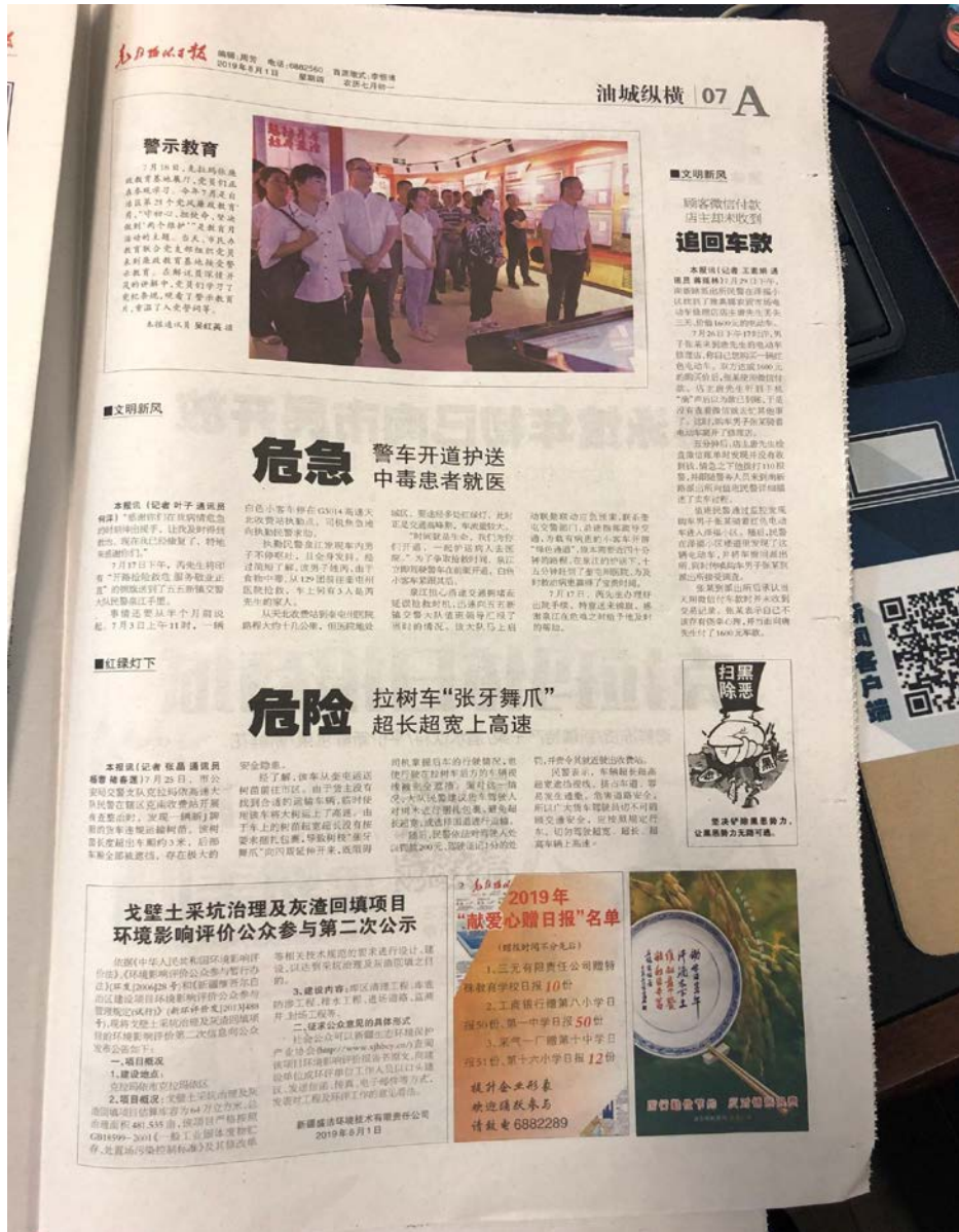
图 3-2-2 2019 年 8 月 1 日报纸公示