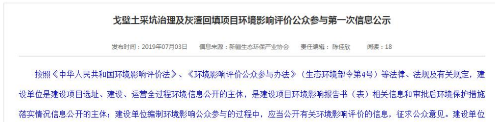
图 2-1 新疆生态环境保护产业协会 首次环境影响评价信息公示截图