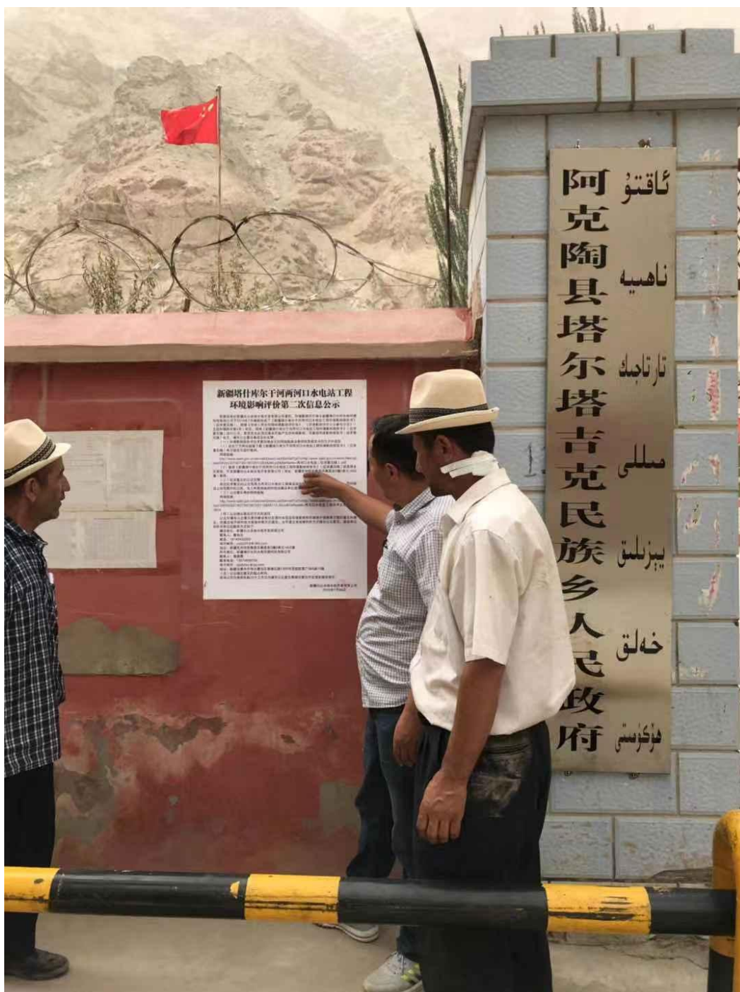
二次公示——张贴公告

在开展网络公示和报纸公示的同时，我单位同步在塔尔乡政府办公地点等公众便于知悉、人流较大的场所张贴了现场公示，张贴区域的选择符合《环境影响评价公众参与办法》的要求。现场公示持续公开日期为 2019 年 7 月 26 日到 8 月 12 日，现场张贴照片见图。