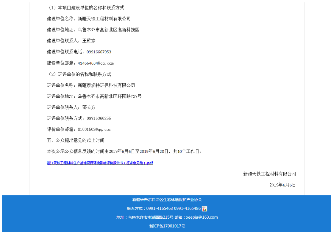
图 2 本项目征求意见稿网络公示截图