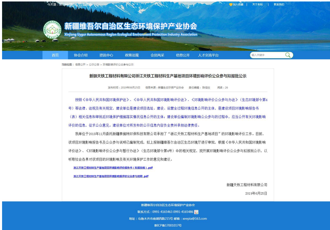
图5 本项目上报前公示

此次公开的是未包含国家秘密、商业秘密、个人隐私等依法不应公开内容的拟报批环境影响报告书全本，载体选择符合《环境影响评价公众参与办法》要求。