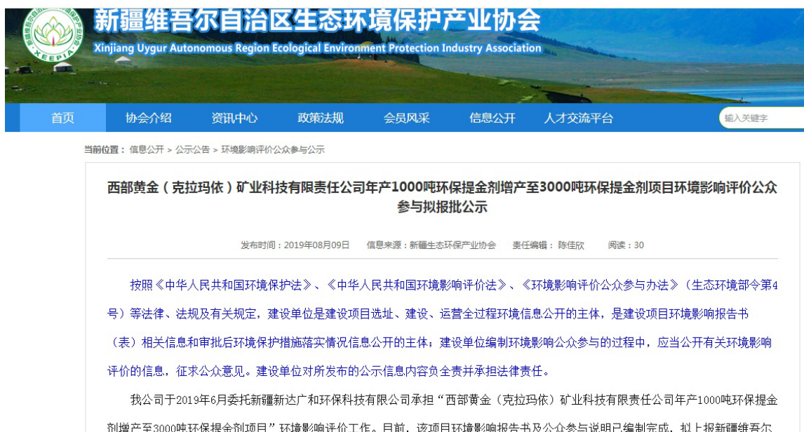
图 6-1 环评文件报批前公示截图

网址为： http://www.xjhbcy.cn/hbcyxh/index/index.html ；公示截图见图 6-1；