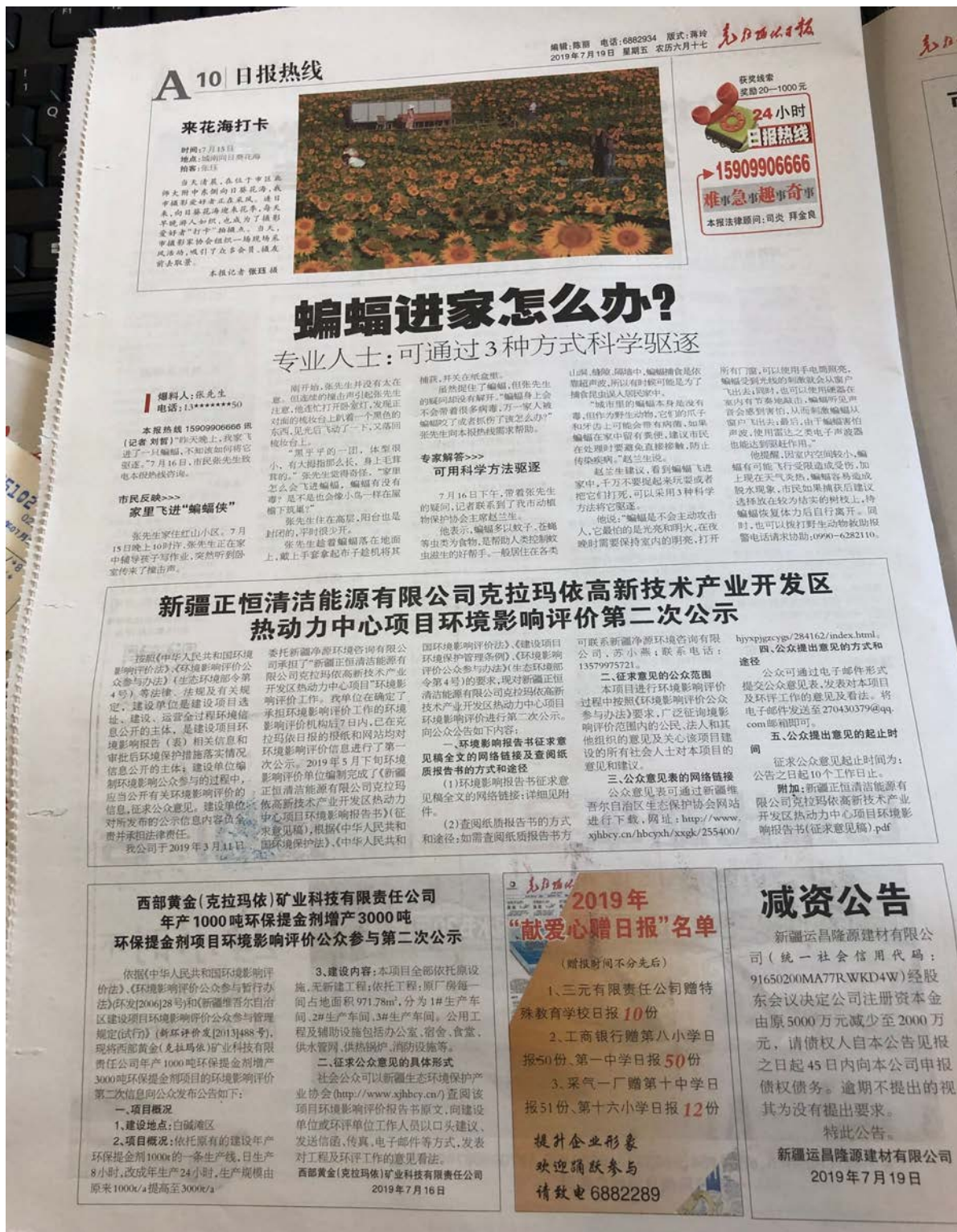
图 3-2-2 2019年7月19日报纸公示