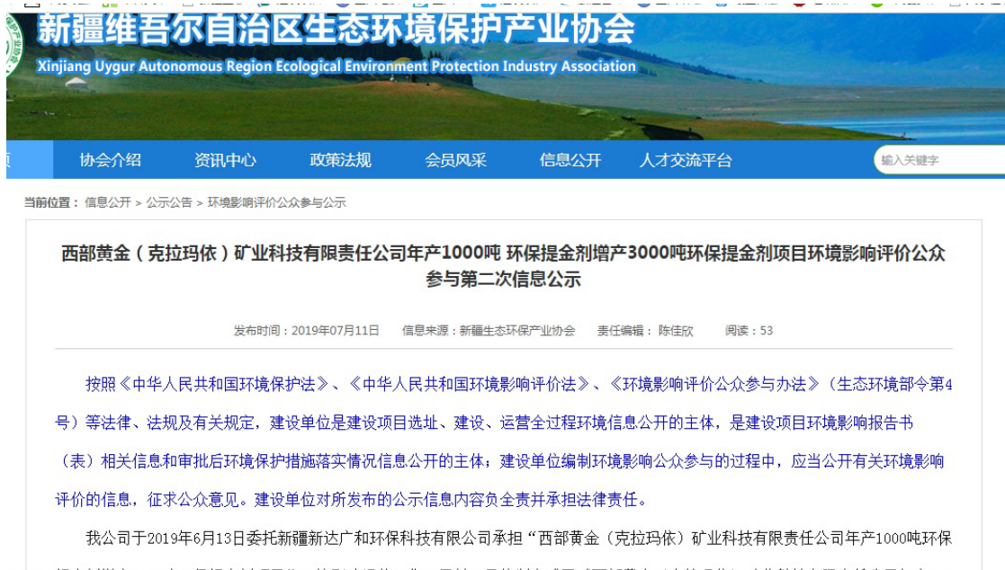
图 3-1 新疆生态环境保护产业协会 第二次环境影响评价信息公示截图