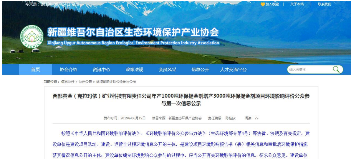
图 2-1 新疆生态环境保护产业协会 首次环境影响评价信息公示截图

本次公示网站为新疆维吾尔自治区生态环境保护产业协会，公示时间为2019年6月19日，公示期限为10个工作日(2019年4月19日~2019年7月2日)，公示网址为： http://www.xjhbcy.cn/hbcyxh/index/index.html ，公示截图见图2-1；