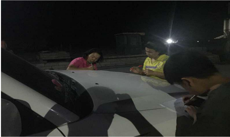
图：执法人员对砖瓦行业进行日常检查

高昌区环保局执法人员重点对环评制度执行情况、污染防治设施建设运行情况进行了检查。同时，对各砖厂负责人如何提高环保意识，减少污染物排放进行宣传和指导。检查发现部分砖厂存在环保手续不全，现场管理环节薄弱，料堆、料场覆盖简易，污染防治设施简陋等问题。针对发现的问题，我局对相关砖厂提出整改要求，并下达责令改正违法行为决定书。