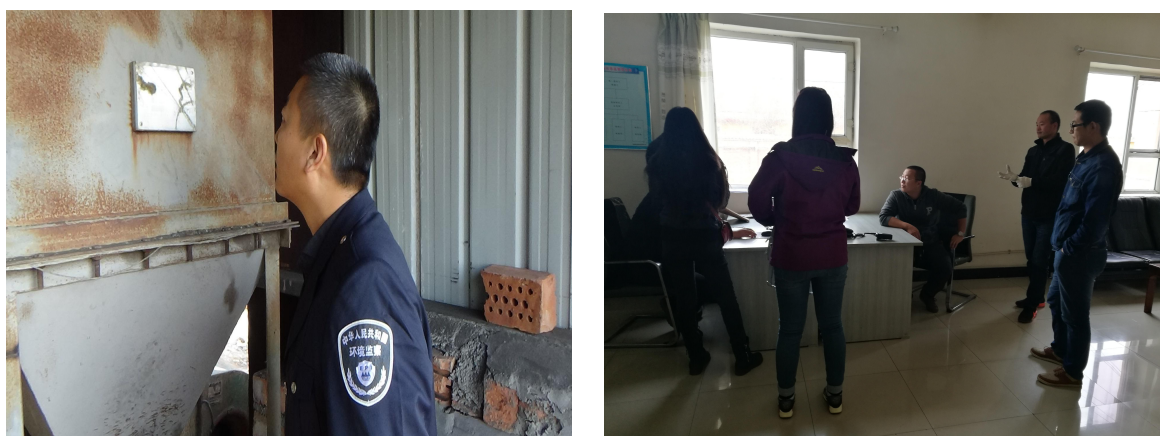
图： 执法人员现场检查照片

依据新《环评法》进行立案查处，这将是新环评法实施以来呼图壁县首个立案的未批先建违法行为，呼图壁县环保局将严格按照法律查处，起到查处一个、教育一片、震慑一方的效果，始终保持惩治环境违法的高压态势。维护群众环境权益和执法对象的合法权益，为建设“花儿昌吉、美丽呼图壁”而努力。