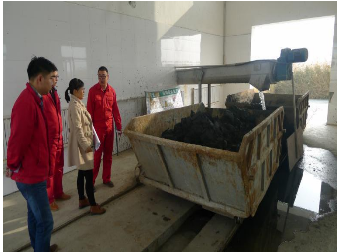
图：环境监察人员在企业现场检查

企业负责人表示通过这次网格化检查考核，进一步提升了污水处理厂主体责任意识，对检查出的工作中不规范、欠缺的地方将认真整改，完善环保档案、自动监控系统自查记录、台账资料，对排污口标识不规范、未开展废气排污申报登记等问题立即整改。