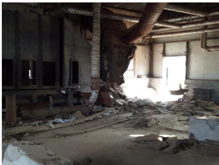
图：燃煤小锅炉清理整治现场照片

通过对辖区燃煤小锅炉清理整治，温宿县环保局已经完成燃煤小锅炉拆改工作 8 家，正在进行拆改建设的 3 家，确保辖区内大气环境稳定。同时，温宿县环保局在对辖区违反“三同时”企业进行了整改，完成治理 8 家，其余正在建设申请验收中。下一步我们开展冬季重点污染源企业环境风险防范安全排查中、对企业应急措施落实及应急物资储备，开展环境应急演练等情况加强监管，引导企业做好环境风险防控工作，确保辖区环境安全的长治久安。