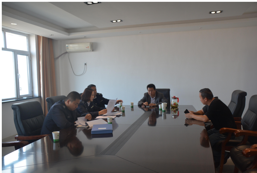
图：执法人员查阅网格化监管巡查记录

近日，昌吉市环保局全面开展环保“网格化”工作检查，市环境监察大队执法人员，对管辖片区进行交叉巡查，对全市9个乡镇环保网格化工作开展情况及现场检查结果，纳入年终考核当中。市环境监察大队执法人员通过现场提问、查阅档案资料、实地巡查秸秆焚烧情况等方式，对乡镇、涉农街道网格监管工作落实情况进行了了解，同时，通过检查促进工作，向网格内监管员再次讲述了昌吉市四级环保“网格”机制的作用，如何发挥各自优势，开展好此项工作等。