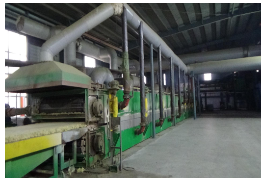
图：执法检查现场照片