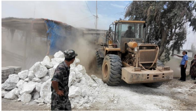
图：执法人员指挥车辆强制拆除

通过此次整治行动，当地生态环境将得到明显改善，有效解决了长期困扰民众的环境污染顽疾，净化了市域大气环境。今后喀什市环保局将继续加大执法监察力度，严厉惩处恶性环境违法行为，切实保障人民群众的合法权益，坚决维护国家法律的尊严。