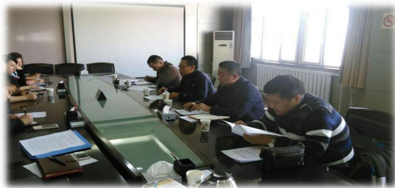
图：克拉玛依市环保局对独山子区环保局大练兵开展情况进行督导

近日，克拉玛依市环保局对独山子区环保局执法大练兵开展情况进行了现场督导，督导组对执法大练兵过程中查处的行政处罚案件进行了指导。同时，对重点企业的污染处理设施运行是否正常、竣工环境保护验收、污染源在线监控设备安装运行和在线比对验收、是否存在偷排、超标排放、各类堆场是否符合要求等情况进行检查。