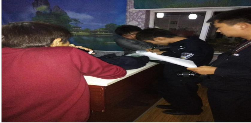
图：检查组在投诉现场检查