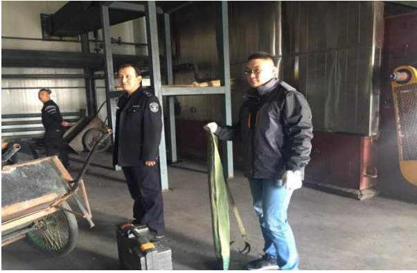
图：执法人员现场检查