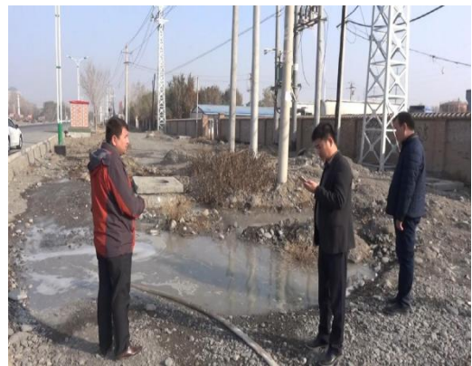
图：执法人员现场检查图片