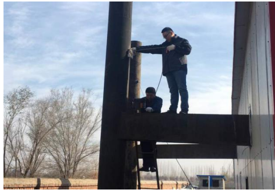
图：监测人员在烟气排放口采样