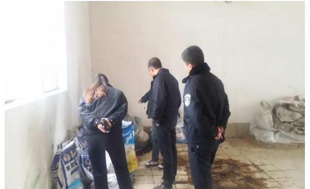
图：环境执法人员对厂区现场检查