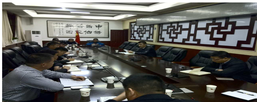
图：察布查尔县召开秸秆禁烧工作部署会议

近期出现部分乡镇农民焚烧秸秆行为，已造成察布查尔县空气中度污染，影响了空气环境质量和人民身体健康。察布查尔县县委、县政府主要领导高度重视此项工作，将秸秆禁烧工作提上工作日程。于 2016 年 11 月 12 日召开了关于秸秆禁烧工作部署会议，察布查尔县县委、县政府、各相关单位以及 15 个乡镇（场）的主要领导参加此次会议。