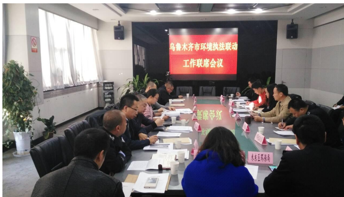
图：乌鲁木齐市召开环境执法联动工作推进会议现场