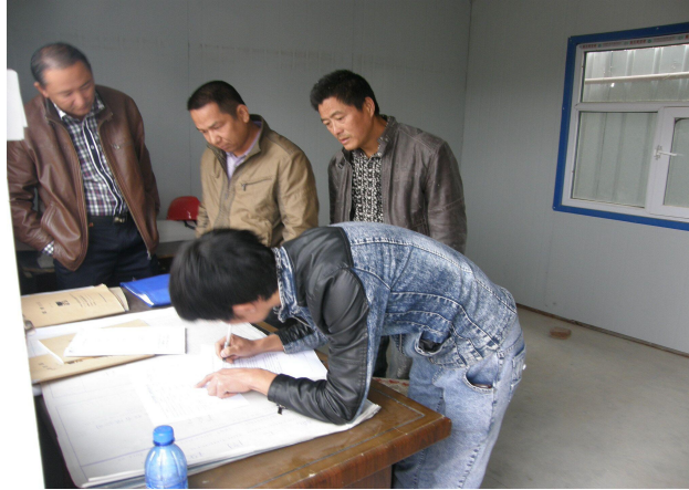
图：工作人员正在发放调查表