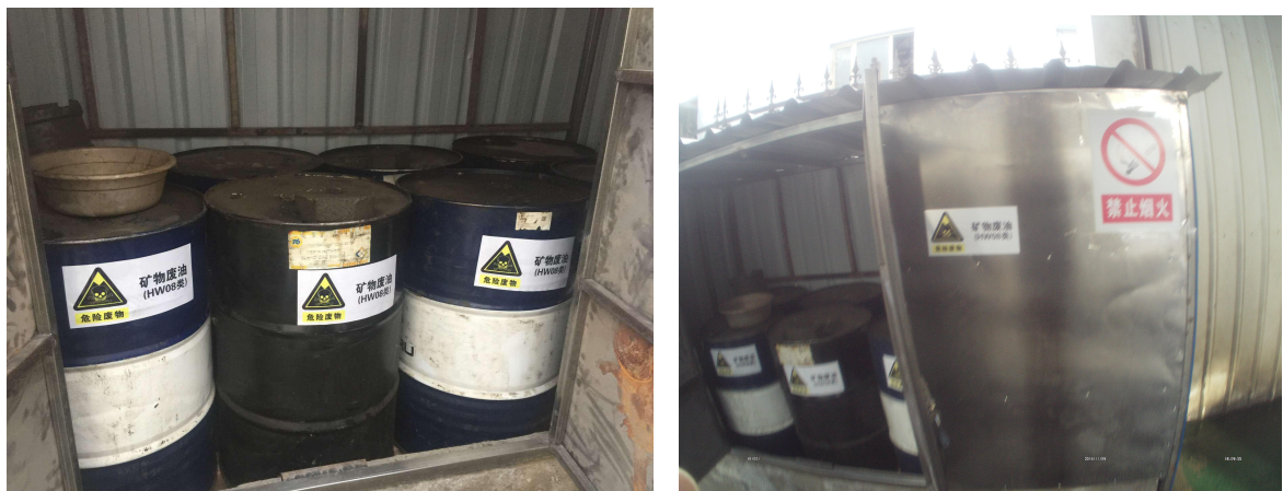
图：库尔勒市环保局对汽车维护店进行后督查

届时，库尔勒市环保局环境监察大队将开展定期或不定期对汽车维护店执法检查，加大巡查频次和力度，切实规范汽车维护行业危险废物（废机油）的收集、贮存、转移和处置工作，使其纳入科学化和法制化的轨道。